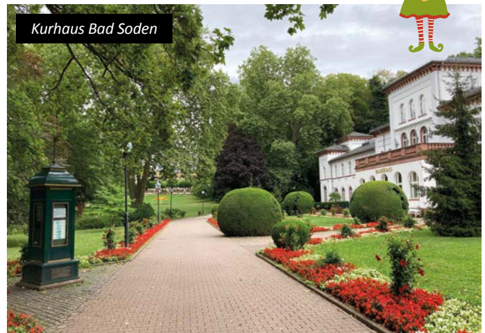
Kurhaus Bad Soden

Im März 2024 spielt und feiert der DBV im Osten Deutschlands im Schlosshotel Schweinsburg. Im Juli 2024 gehen die Festspiele in den Taunus bei Frankfurt. Die Eventzeit im H+ Hotel Bad Soden am Taunus ist um einen Tag länger als im Schlosshotel Schweinsburg, d. h. von Donnerstag bis Sonntag treffen sich Bridgespieler aus ganz Deutschland. Die Teilnahme ist auch als Tagesgast möglich.