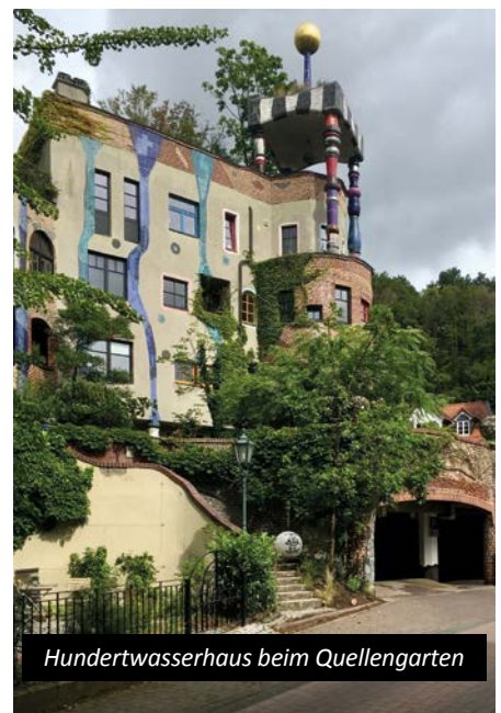
Hundertwasserhaus beim Quellengarten