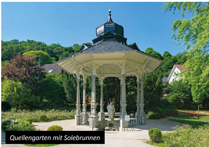
Quellengarten mit Solebrunnen